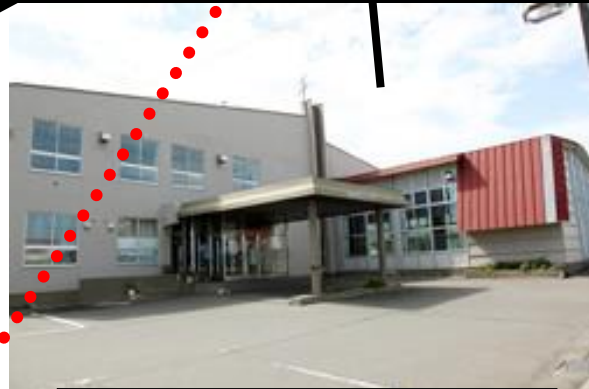
厚岸町生活改善センター