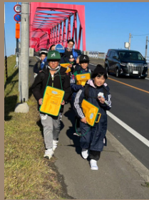
ハザードマップづくりで厚岸の避難場所や防災標識を探そう！