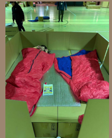
段ボールベッドで寝てみよう！

プログラム2 「防災×キャンプ ご飯&おかし&飲み物づくり」 プログラム3 「防災小説」