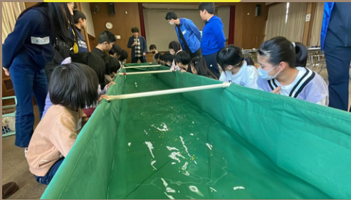
津波発生装置で津波のメカニズムを知ろう