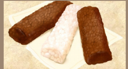
夕食といっしょにおかし作りも楽しもう♪