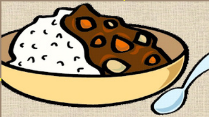
長期保存できる素材でカレーづくりをしよう！

プログラム2 「防災×キャンプ ご飯&おかし&飲み物づくり」 プログラム3 「防災小説」