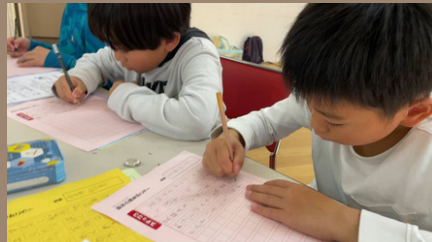
2日間の学びを小説にまとめよう！